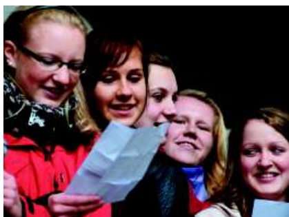
Begegnungstag des Anna-Zillken-Berufskollegs

Der Schuljahresbeginn im Spätsommer 2009 wurde mit einem Sponsorenlauf des Anna-Zillken-Berufskollegs im Dortmunder Fredenbaumpark begonnen. Der Tag bot, mit einem durch die Studierenden gestalteten Bühnenprogramm und gemeinsamen Spielen, die Möglichkeit, dass „neue“ und „alte“ Studierende sich kennen lernten. Die Studierenden engagierten sich mit ihrem Lauf für soziale Einrichtungen und die Schulausstattung. Mit den Mitteln konnten bereits neue Kajaks, Kletterseile, Bälle und Spiele für die erlebnispädagogische Abteilung des AZB angeschafft werden. 2009 wurden rund 5.000 Euro „erlaufen“.