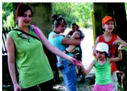
Kinder des „Therapiezentrum für Kinder mit Behinderungen“ der Caritas Ruse besuchen einen Bauernhof.

Auf Anregung der Aktion Mensch wird das erfolgreiche litauische Projekt der Bundesgeschäftsstelle des SkF seit 2009 nun auch im Kreis Ruse (Pyce)/Bulgarien realisiert. Finanziert aus dem Förderbereich „Aufbau von Basisstrukturen Mittelost- und Südosteuropa“ der Aktion Mensch, konnte das erfolgreiche Referenzprojekt auch auf die besondere Situation in Bulgarien übertragen werden. Dort baut der SkF Gesamtverein zusammen mit seinem bulgarischen Partner Caritas Ruse bis 2012 eine mobile Beratung auf.