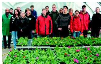
Auszubildende Werker und Werkerinnen im Gartenbau

Berufsbildungsgesetzes sollen behinderte Menschen (§ 2 Abs. 1 Satz 1 des SGB IX) in anerkannten Ausbildungsberufen ausgebildet werden. Die Feststellung, dass Art und Schwere der Behinderung eine Ausbildung in einem Helferberuf erfordern und nicht in einem anerkannten Ausbildungsberuf, erfolgt auf der Grundlage einer differenzierten Ausbildungsseignungsuntersuchung.