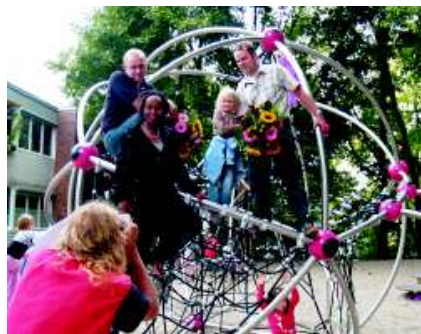
Einweihung des neuen Spielplatzes

Durch das vergleichsweise hohe Spendenaufkommen im Jahr 2008 konnte die Neugestaltung des Spielplatzes umgesetzt werden, der im September 2009 unter Beteiligung von Sponsoren, Presse und Rundfunk eingeweiht wurde. Eine moderne Kletteranlage und zwei Schaukeln konnten von den hoch erfreuten Kindern „in Betrieb“ genommen werden. Diese Investition wäre vor Jahren aus einem dafür vorgesehenen Etat getätigt worden. Gerade aber im Bereich der Instandsetzung und -haltung sind die Mittel drastisch gekürzt worden, so dass ohne Unternehmenskooperationen solche Ausgaben für das Jugendhilfzentrum Haus Conradshöhe nicht mehr denkbar wären.