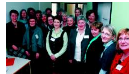
Teilnehmerinnen „Basiskompetenzen für Vorstände“

Erwachsenenbildnerin im Themenbereich Kommunikation und Moderation, gewonnen werden. Modul 4 wird in Kooperation mit der Landesstelle Bayern durchgeführt und findet in Würzburg statt.