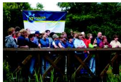
„Uns schickt der Himmel“ – 72-Stunden-Aktion des BDKJ im Anna-Katharinenstift Karthaus

Die Zahl der Ehrenamtlichen, die das Anna-Katharinenstift unterstützen, hat sich 2009 auf über 60 Personen erhöht. Dies gelang durch eine rege „Werbung“ um An-