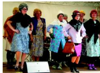
Aktionstag der Jugendhilfe Am Rohns

Der Aktionstag, der alle drei Jahre von den Einrichtungen der stationären Erziehungshilfe im Bereich des Caritasverbandes für die Diözese Hildesheim veranstaltet wird, wurde im August 2009 unter dem Motto „Spielend forschen und entdecken“ das erste Mal von der Jugendhilfe Am Rohns in Göttingen ausgerichtet.