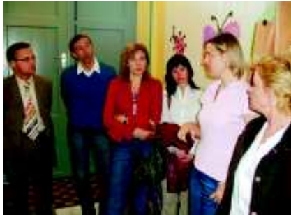
Konferenzteilnehmer der 3. Konferenz des Projekts „ESCAPE“ in Luxemburg

Seit dem 01. August 2006 führt die Verwaltung der SkF Zentrale gemeinsam mit ihren europäischen Partnern Caritas „Luxembourg“ (Luxemburg) und Vsl „Socialis“ (Litauen) die Lernpartnerschaft „ESCAPE into life - European Social Concept an Professional Employment“, gefördert aus dem Sokrates-Programm der Europäischen Union - Grundtvig 2 durch.