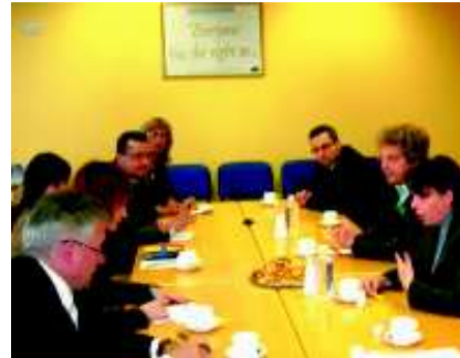
Partner im Projekt „ESCAPE“ vor dem Vorsitzenden, Mitgliedern und MitarbeiterInnen des Sozialausschusses des Parlaments der Republik Litauen.

geführt. Die Ergebnisse des Projekts werden in einer Dokumentation veröffentlicht.